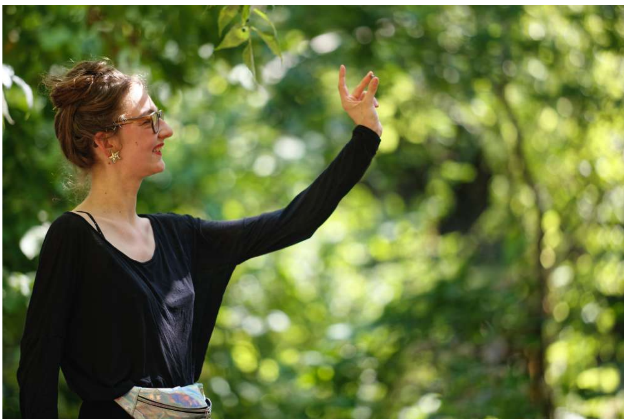
La fée et son petit caillou

Et peu à peu, elle fait l'éloge d'un autre rapport au monde, invitant à faire attention à ce qui nous entoure, à accorder de l'importance à ce que personne ne trouve important. À être attentif.